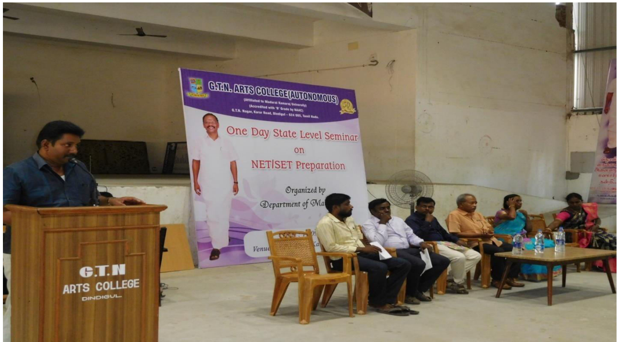
Vote of Thanks